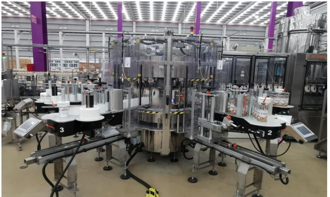
Línea de Manufactura de Shampoo

1.8 millones de botellas de shampoo producidas durante 2T-2022