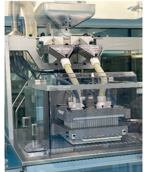
Línea de Manufactura de Productos Sólidos OTC