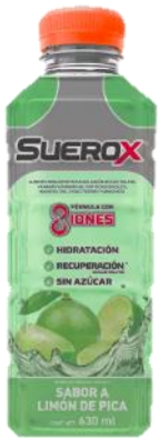
Lanzamiento de Suerox® en Chile