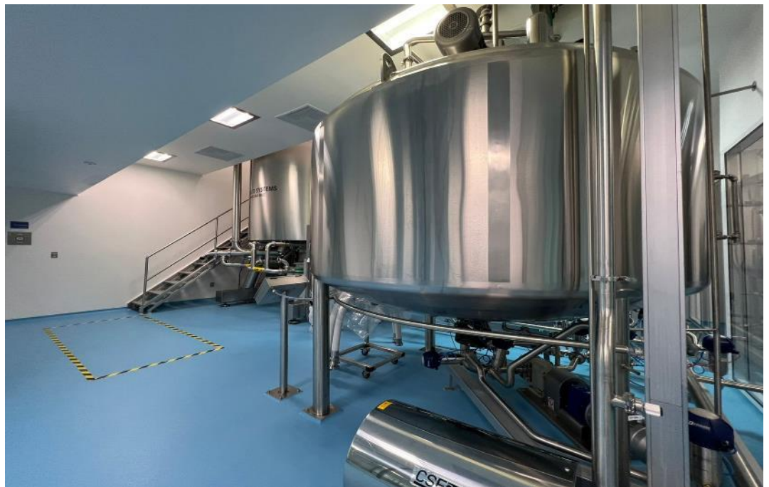
Línea de Manufactura de Productos Semi-sólidos OTC

100% de la demanda nacional para X Ray ® Gel producida en nuestra planta OTC